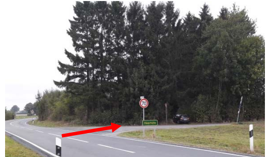
Einfahrt von Osten