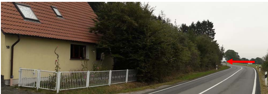
Haarhöfe 18 und Einfahrt von Westen